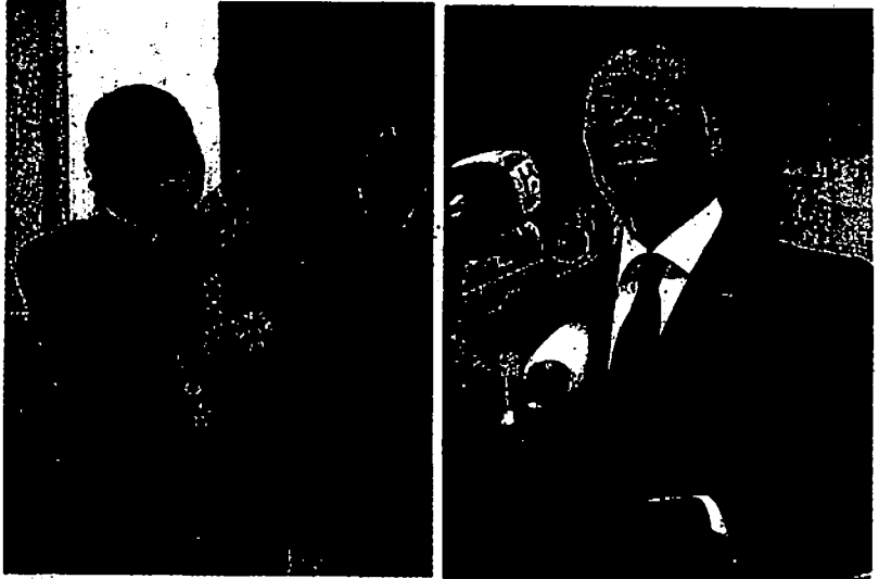
4日、コートジボワールの最大都市アビジャンで、それぞれ大統領の就任宣誓を行うバグボ氏(左)とワタラ氏(右)

【ロンドン＝松井】大統領選決選投票後に政局不安が高まる西アフリカ・コートジボワールで、憲法評議会の認定により一転して再選を決めた現職バグボ氏(左)が四日、大統領府で就任を宣誓した。一方、選挙が当選と発表した野党のワタラ氏(右)も別の場所で行った宣誓式で、二人の大統領が自ら正統性を主張する真逆事態に陥った。 ロイター通信などによると、バグボ氏は宣誓式で「選挙が出したものは暫定結果で、憲法評議会が出したのが本当の結果だ」と強調した。これまでバグボ氏 た。選挙監視に当たった国連や旧宗主国のフランス、米、アフリカ連合(AU)、欧州連合(EU)は、選挙の集計結果をめぐってワタラ氏が正統な大統領だと指摘しているが、バグボ氏は「内政干渉だ」とはねつけた。これまでバグボ氏