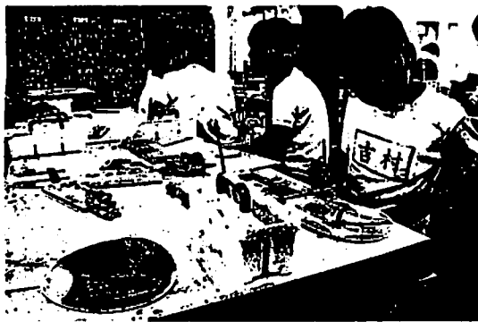
うちわを制作する児童—浅野川小