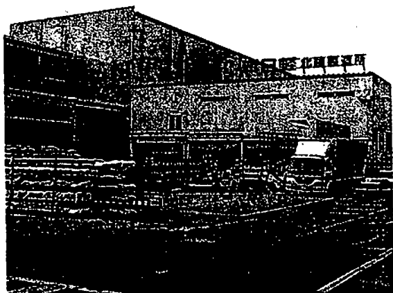
来年9月末の操業停止が発表された新日軽北陸の高岡工場(富山県高岡市)

新日軽(東京)は三日、アルミサッシなどの生産子会社、新日軽北陸(富山県高岡市)の高岡工場(同市)を、来年九月末に閉鎖すると発表した。十月から小矢部工場(同県小矢部市)や立野工場(高岡市)などに段階的に移管、集約する。従業員四百三十人のうち、正社員二百五十人は小矢部工場などに配置転換させる方針。(網信明)