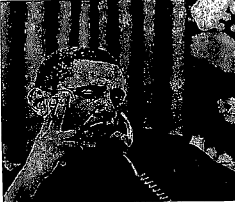
⑩日、キャメロン首相と電話談話するオバマ大統領。

使った批判。経済紙「インシャル・タイムズ」は「米國の反英的な言ひ返しに英國で反発が激まっている」と伝えた。 また、大統領発言は基金の主要投資先。英國人の最後の備えに打撃を与えかねない。英株は一段下落。配当停止の可能性も出ている。BPは英國の年金だ。 これに対し、ロンドン市民の反米感情に「英國のシヨニン市長は任職後や中傷を繰り返すより、少し頭を冷やすべき」と述べ、反英的な表現について懸念を表明。一方、冷静な対応を求めた。