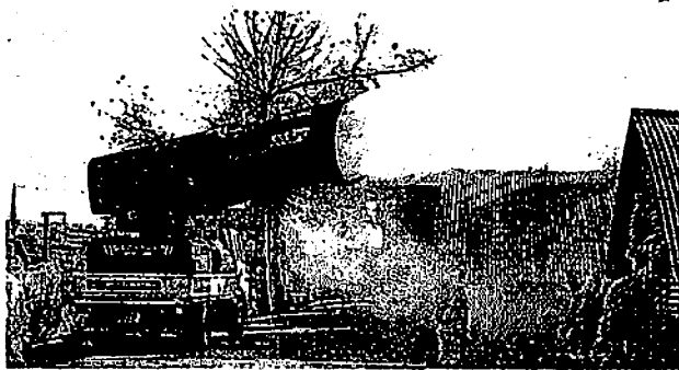
農水産省が導入したものと同系統の大型薬剤噴霧機。写真は、韓国で活用する様子

宮崎県で口蹄疫の感染が広がりをみせる中、家畜伝染病対策のため、農水産省が三月に動物検疫所門司支所(北九州市)に配備した、大型薬剤噴霧機が活用されることなく、お蔵入りとなっている。消毒液などを霧状にして最大約六十分先まで散布でき、広範囲の消毒作業に有効とされる。韓国の口蹄疫対策でも効果を上げていたが、国と宮崎県の意思疎通が不十分なために「宝の持ち腐れ」状態で、関係者からは「今回、使わなければいつ使うのか」との声が出ている。