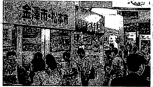
香港の国際旅行博に出展した金沢市のブース

香港から県への観光客が近年急増していることから、金沢市は十日から十三日まで香港で開かれる旅行博「第二十四回香港国際旅遊展」にブースを出展した。市職員一人を現地