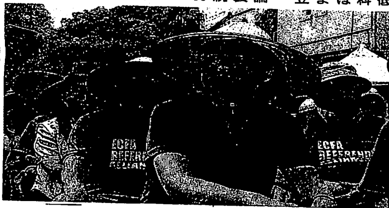
台北市の25日、中台の E C F A の早期締結 (二) 締結して、その結果を馬英九の蔡英文主席

馬總統が任期を折り返 選挙を相次いで迫られ した。任期後半に入る。(台北・栗田秀 彦氏)