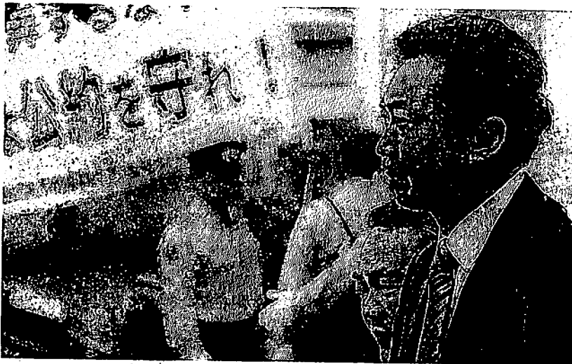
23日、那覇市を訪れた鳩山首相。沖縄県民の移設問題は高まる一方だが、社民党は連立を離脱しないのか。

米軍普天間飛行場(沖縄県宜野湾市)の移設問題は、めぐりめぐって結局、自公政権時に決めた同県名護市辺野古に戻ってきた。「最低でも県外」と大見えを切った鳩山由紀夫首相への風当たりは強まる一方だが、連立政権で県内移設に強く反対を唱えてきた社民党の姿勢も問われている。それでも社民党は連立を離脱しないのか。(桑澤誠)