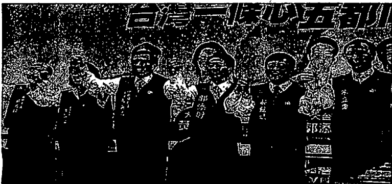
台北の国民党本部で12日、5大都市の市長選挙候補者とともに氣勢を上げる馬英九総統(左から3人目)

「ただの(良い)人」から「執政も良い」となるように注文する。有力な対抗馬になりそうな蔡主席。各メディアは「民進党の支持基盤である独立・本土派の支えが鈍いなど伝え、二年後の総統選の話題が紙面を飾る。 東亜大学政治学科の羅致政教授は「次の総統選の勝機は国民党が五分五分。問われるのは兩岸(中台)政策と(執政)能力だ」と語り、二度の政権交代を経た台湾民主化の試金石になる重要な選挙と位置づけた。(台北・栗田秀之、写真も)