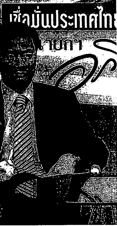
16日、バンコクのテレビ局で、険しい表情を浮かべ演説するアヒシット首相。

タイに本来の民主主義がなかなか根付かない理由には、第二次大戦後の特殊事情もある。政治的対立が深まるたびに、軍のクーデターや国民が敬愛するプミポン国王(左)の「裁定」で決着。超法規的な手法で難局を乗り切ってきたためだ。だが、国王は体調を崩して長期入院中で「政治介入」はできない。政府が国民を納得させる解決策を示さない限り、たとえ今回の騒乱が収束しても、政治的対立は続くだろう。