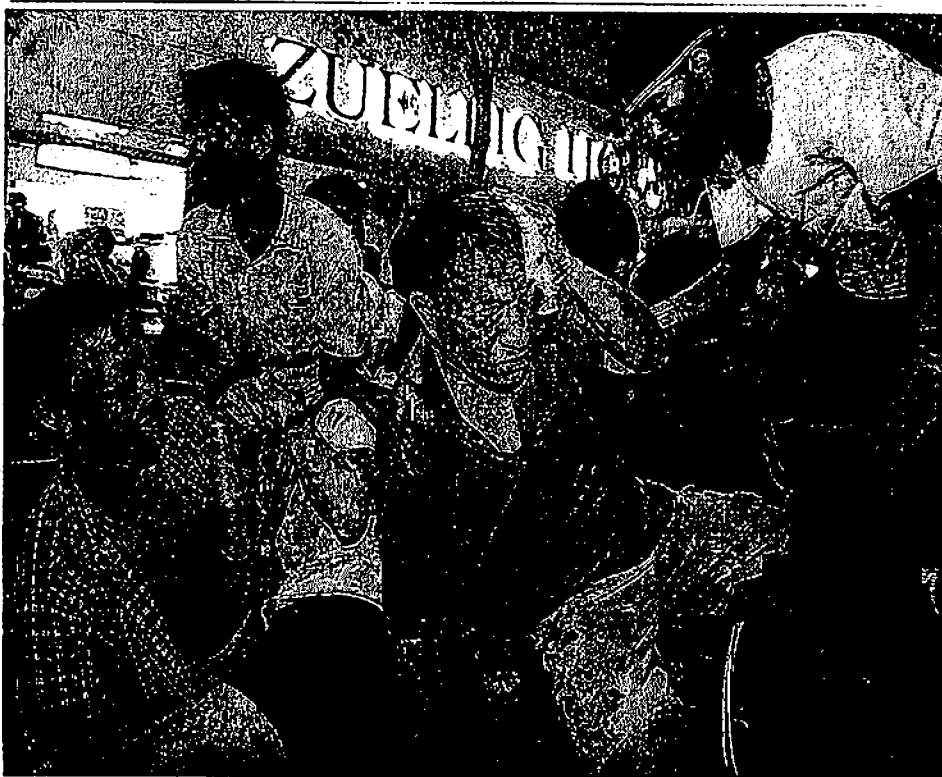
【バンコク】林浩クスのビジネス街シーロムラテン駅付近で二十樹】タイの首都バンコム通りの高架鉄道、サニ日夜、六回の爆発が

あり、病院関係者らによると、タイ人一人が死亡、欧米人とみられる外国人を含む少なくとも七十五人が負傷した。うち十人が重体で死者はさらに増える恐れがある。