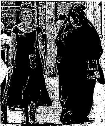
フランス南部マルセイユで昨年6月、ニカフを着て歩く女性⑤

委員会審議ではイスラム系議員を含む全会派が法案に賛成した。西国の動きについて複数の人権擁護団体が「自らブルカを着たいと望む女性の権利を無視」と批判している。AFP通信などによると、このほか欧州ではデンマークで一月に公共施設でのブルカ着用禁止が決定。イタリ