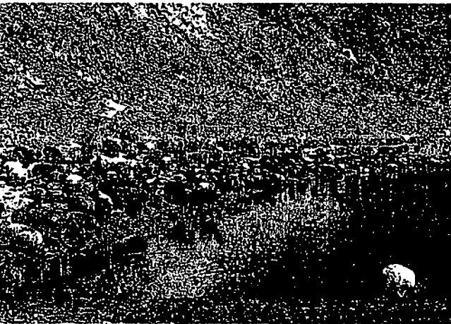
砂漠地帯の水路沿いには、遊牧のヒツジが群れをなして集まってくる。

治安維持部隊の往来が激しい。ヌーリスタンに至る主要道路、シヤラバードとチャカサライ間は軍用道路の様相を呈している。険しい顔つきの外、先日、長い米軍の車列を乗せた装甲車の長はすれ違ふとき必ず停車して通過を待つ。「助く